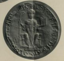
Die zur Abbildung von Th. Dorn: Hauptmünze und Repräsentation in München.