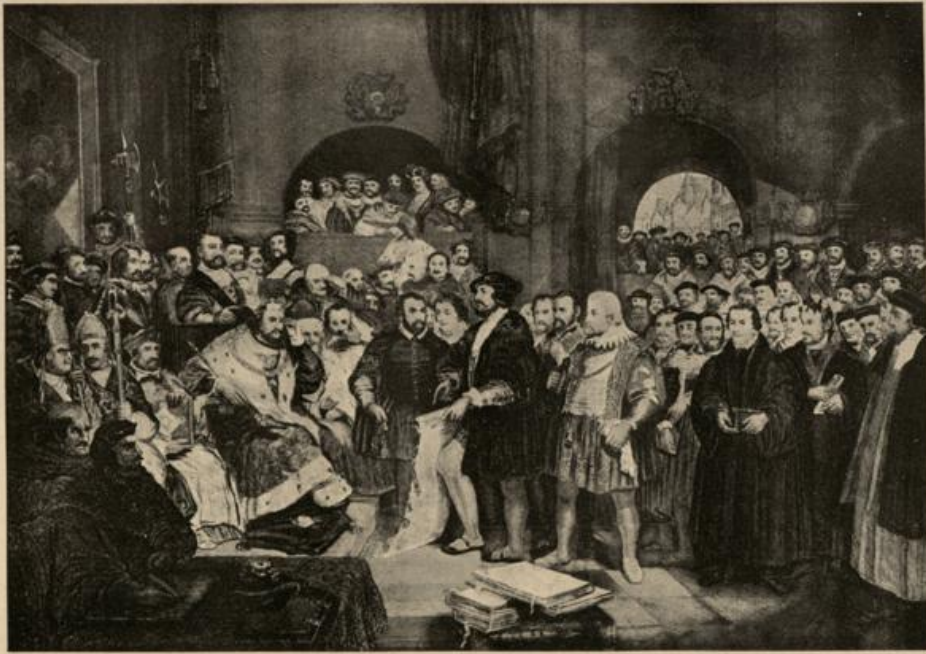
Die Protestation der evang. Stände auf dem Reichstage zu Speyer 1529.