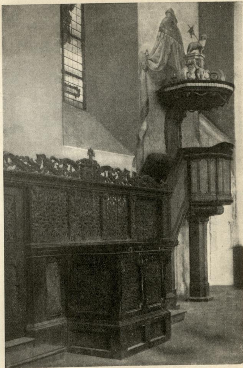
Kanzel mit Pfarrstuhl