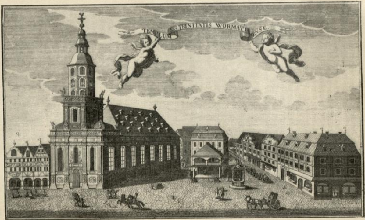
Verkleinerte Wiedergabe eines Kupferstiches aus dem Jahre 1725