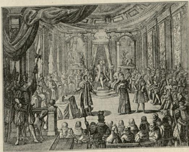
Luther vor dem Reichstag in Worms Augsburger Kupferstich von C. Remsbart 1721

Somit Gesamtausgabe für Kirche und Einrichtung 45,488 fl. 30 fr. = M. 77,980.30. Hierzu kommen allerdings noch recht bedeutende Schenkungen an Bauholz und unentgeltlich oder wenigstens zu ermäßigtem Preis gelieferte Arbeiten und von Seiten der Stadt der frei zur Verfügung gestellte Bauplatz und das durch Abbruch an verschiedenen Stellen gewonnene Steinmaterial. Wenn man dies berücksichtigt und daß die Kaufkraft des Geldes damals (Taglohn 60 Pf.), 5- bis 6mal so groß war wie heute (1909), wird man über den scheinbar niedrigen Betrag der Ausgaben nicht mehr sehr erstaunt sein.