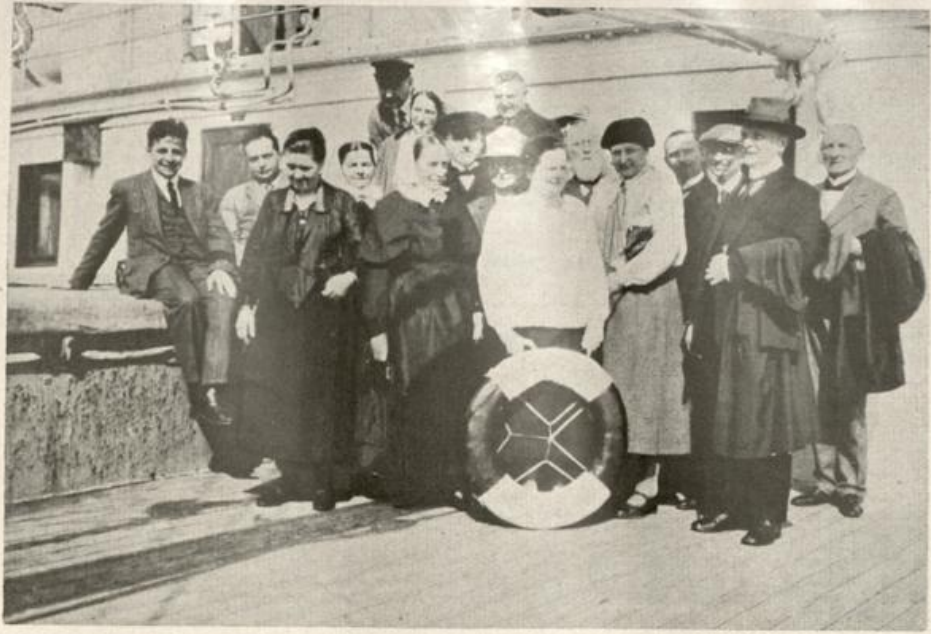
Die Reisegesellschaft auf dem Dampfer Helouan