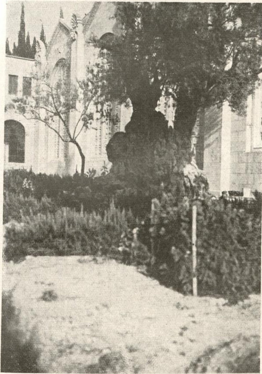
Im Garten Gethsemane