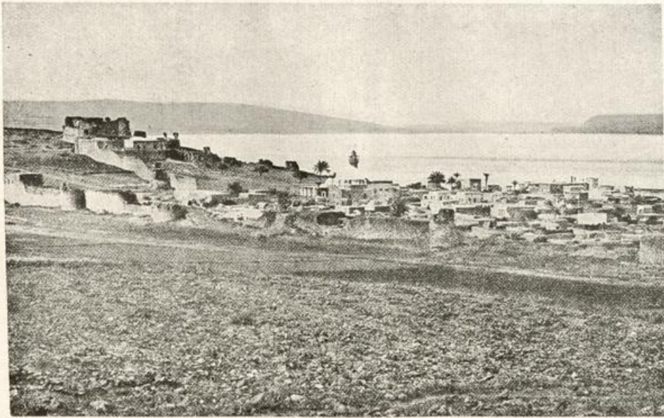
Tiberias und See Genezareth