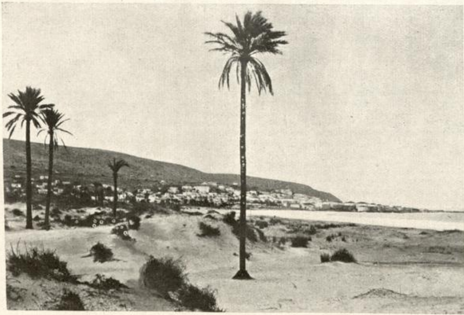
Haifa und das Karmelgebirge