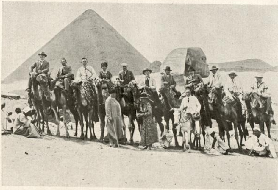
Vor den Pyramiden und der Sphinx in Gizeh (Aegypten)